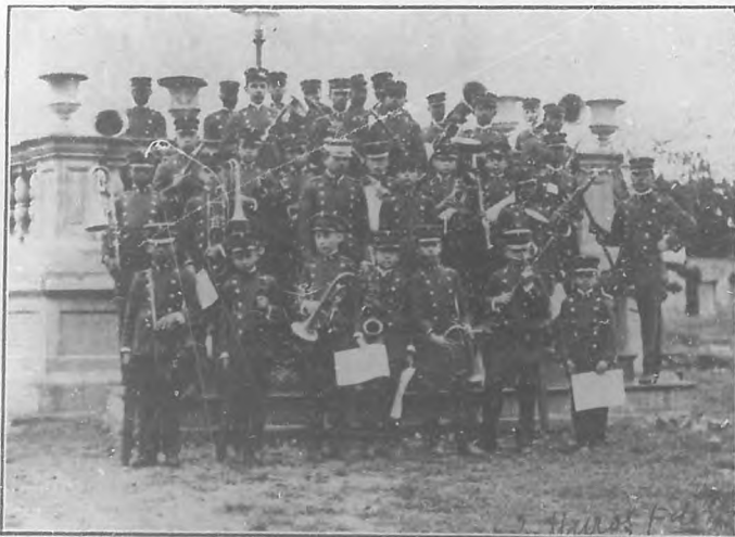
«Banda Municipal» infantil, de Camajuani.