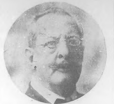
† DR. FERMÍN VALDÉS DOMÍNGUEZ

No hemos de hacer biografía del ilustre desaparecido. Ello fuera casi una ofensa a los que no podemos ignorar los hechos de los "buenos" que nos van abandonando. . . . Una fotografía que perpetúe en nuestra colección la memoria del Dr. Valdés Domínguez; y un recuerdo, que no le honrará fácilmente. Éste es nuestro modesto homenaje.