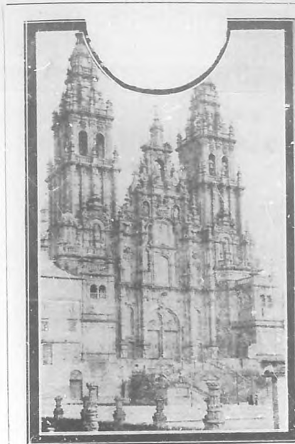
Catedral de Santiago de Compostela.