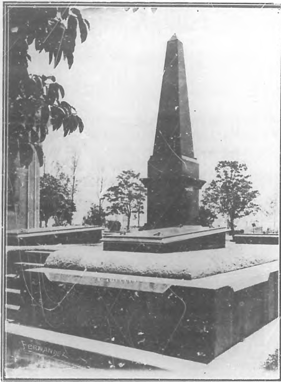
Mausoleo donde reposan los restos del Generalísimo Máximo Gómez