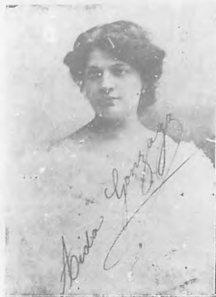
AIDA GONZAGA, notable cantante.

Por nuestra parte, no faltaremos; y hablaremos de cuanto en él ocurra, de las obras y de los actores, algunos desconocidos y de los que tenemos muy buenas referencias.